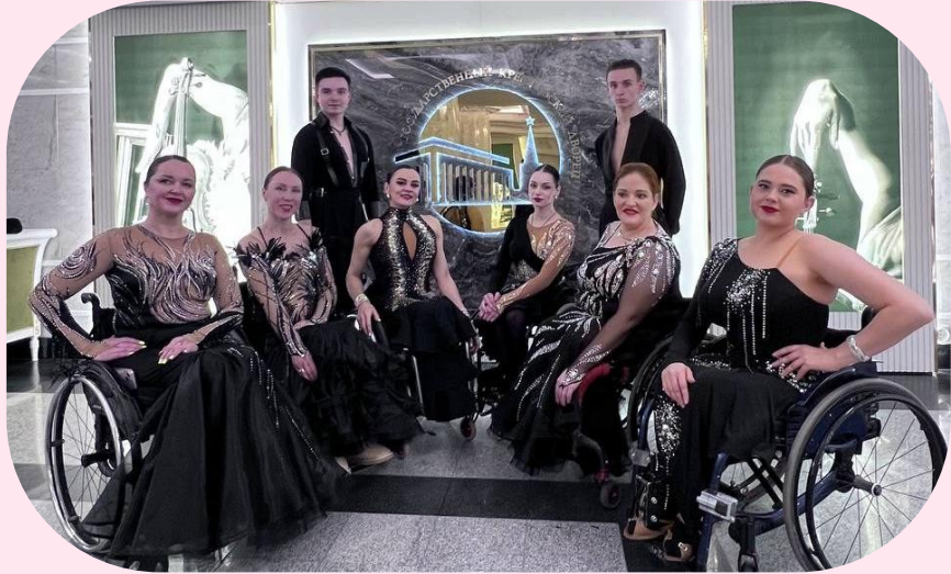
Выступление на юбилейном концерте Натальи Гулькиной в Государственном Кремлевском Дворце!