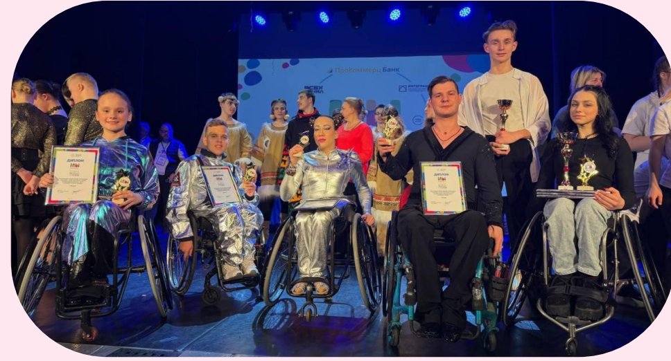
Гран-при и пять первых премий на инклюзивном фестивале "Мы"!

Выступали на инклюзивных концертах «Настоящее в тебе», на выставке в Экспоцентре «Интеграция 2025», приняли участие в уникальном танцевальном спектакле в Геликон опера, посвященному Дню театра с чемпионами мира по спортивным танцам.