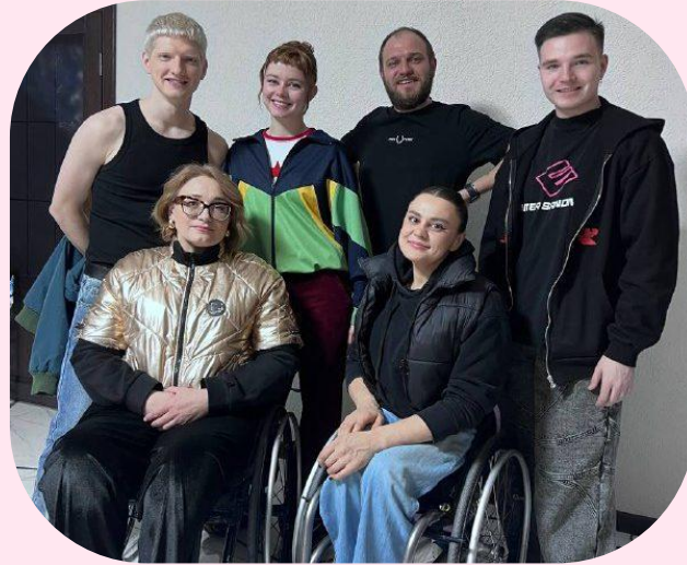
Участие в съемках фильма "Встать на ноги"